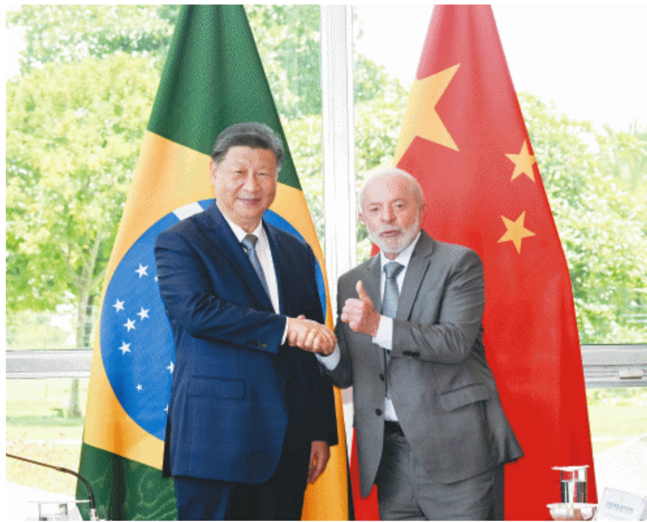
当地时间11月20日上午，国家主席习近平在巴西利亚总统官邸黎明宫同巴西总统卢拉举行会谈。

新华社巴西利亚11月20日电(记者倪四义 陈威华)当地时间11月20日上午，国家主席习近平在巴西利亚总统官邸黎明宫同巴西总统卢拉举行会谈。两国元首宣布，将中巴关系定位提升为携手构建更公正世界和更可持续星球的中巴命运共同体。初夏时节的巴西利亚，天朗气清。黎明宫内，绿草如茵，450名威武礼兵整齐列队。在120名龙骑兵护卫下，习近平乘车抵达黎明宫前广场。卢拉总统和夫人罗桑德拉热情迎接习近平，并为习近平举行隆重盛大欢迎仪式。军乐团奏中巴两国国歌。两国元首一同观看仪仗队分列式。中巴儿童挥舞两国国旗热烈欢送习近平。巴西艺术家用中文演唱《我的祖国》。两国元首分别同对方陪同人员握手致意。