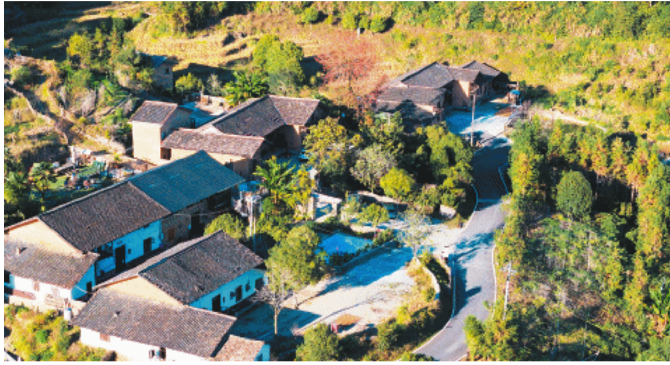
湖洋梯田民宿集聚区。

瀑布溪流密布,幽谷奇石层叠,青山叠翠又村道通达,民宿连点串线成片,梯田四季风景各异,夯土墙房屋里传承着古老技艺……这里是长沙市福地原乡美丽宜居村庄示范片,由浏阳市的张坊镇和小河乡共同打造,小溪河在这里发源,山水、美宿、特色农产品、非遗文化,每年吸引着数以万计的游客慕名游览。