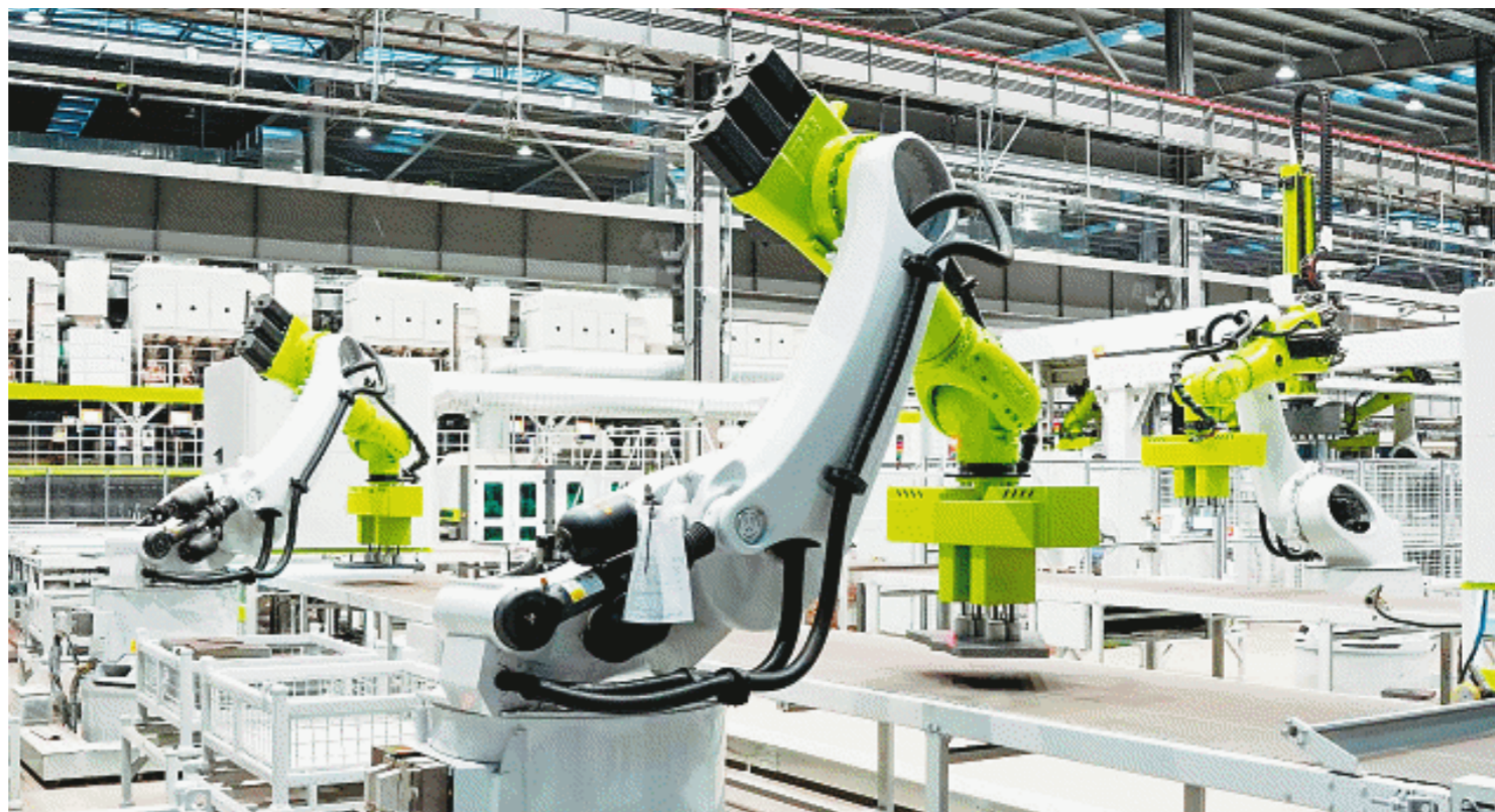
中联重科入选质量强国建设领军企业培育库。图为中联重科智能工厂生产线。资料图片

持续提升，综合实力不断增强 长沙纵深推动质量强市建设，产品、工程、服务、环境等质量总体水平