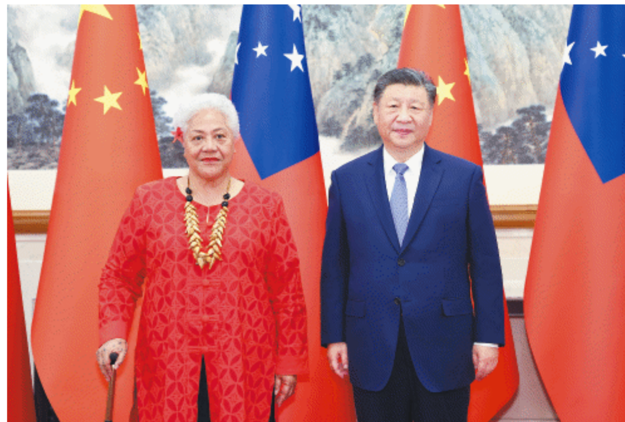
11月26日下午，国家主席习近平在北京钓鱼台国宾馆会见来华进行正式访问的萨摩亚总理菲娅梅。

新华社北京11月26日电(记者 冯欣然 曹嘉琪)11月26日下午，国家主席习近平在北京钓鱼台国宾馆会见来华进行正式访问的萨摩亚总理菲娅梅。