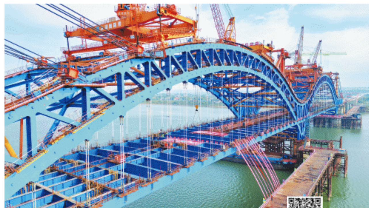
11月26日上午，暮坪湘江特大桥主桥顺利合龙，大桥主体工程正式完工。

长沙晚报11月26日讯(全媒体记者 陈焕明 通讯员 慕琪 夏琪 唐文成)“合龙了，合龙了……”11月26日上午，在长沙城南，湘江之上，随着最后一段钢桁梁安装完成，全国首座“双飞燕”四跨连续中承式钢桁拱柔性系杆拱桥——暮坪湘江特大桥主桥顺利合龙，大桥主体工程正式完工。