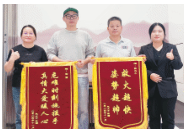
业主和物业为两位救火英雄送上锦旗表示感谢。

讯(全媒体记者 孙占锋)“不好,楼下着火了!”情况紧急之下,立马关闭楼上的门窗,到楼道里取灭火器,走楼梯赶到灭火现场,拉闸断电、上下点灭火,5分钟后明火被成功扑灭……如此惊心动魄的一幕,日前就发生在雨花区芙蓉中路某小区内,沉着冷静灭火的两个人则是一名家装设计师和一位项目经理。26日,鸿扬家装的这两位员工得到公司表彰。