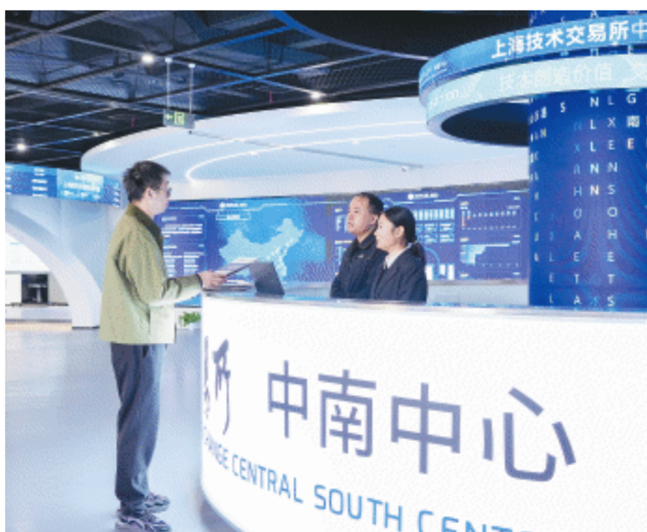
上海技术交易所中南中心积极推动科技创新与产业创新深度融合，为区域产业链升级和创新生态构建注入强劲动力。