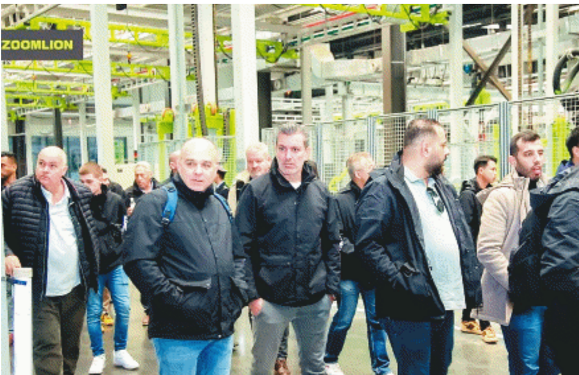
11月29日，海外客商探访中联智慧产业城。

近年来，长沙工程机械品牌在走出去、走进去、走上去的同时，也吸引了海外客商走进来。据了解，随着中联重科全球市场的拓展，今年到访中联智慧产业城实地考察智能工厂、产线的海外客商比往年增加了10倍，接近2000人次，中联重科国际朋友圈更广、更深、更铁。