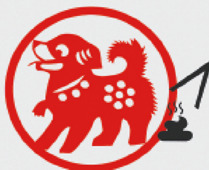
及时为它清理粪便