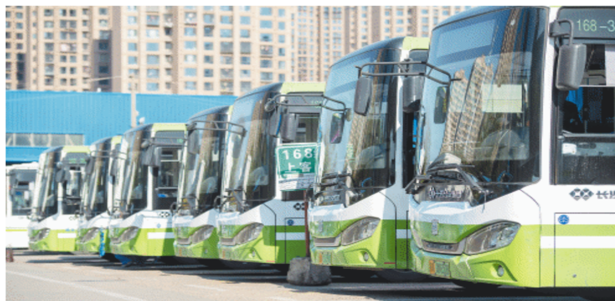
在长沙公交集团汽车东站始末站，公交车干净整洁停在站场。

“常规公交客流逐年下降是行业共性问题，但常规公交如同‘毛细血管’，仍具有不可替代的优势。”该负责人表示，作为“地铁口到家门口”这段距离的交通工具，共享单车虽方便但风吹日晒，网约车虽便捷但价格不适合每日通勤，相比之下，常规公交经济、灵活、舒适，应填补轨道交通服务空白，承担