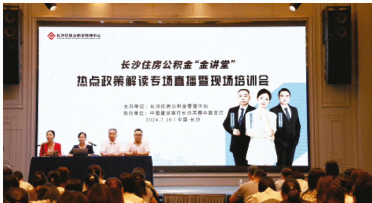
长沙住房公积金“金讲堂”。 资料图片

统计数据显示,今年1至11月,全市新增住房公积金开户单位7233家;新增开户职工23.7万人;完成住房公积金归集金额237.46亿元,同比增长4.96%。截至今年11月底,住房公积金累计归集总额1971.81亿元,归集余额868.98亿元。