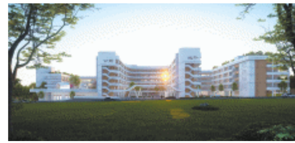
雨花区仙姑岭小学效果图。长沙晚报通讯员陈静 供图

“为确保项目早日完工,全区各个部门齐心协力配合,比如学校正门的桃花路,为了方便学校师生出行便利,我们特事特办,加速桃花路的施工建设。”雨花区发改局相关负责人介绍,目前,桃花路施工已部分完成,预计开学后,孩子们上学就能实现便利通行。