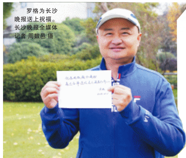
罗格为长沙晚报送上祝福。