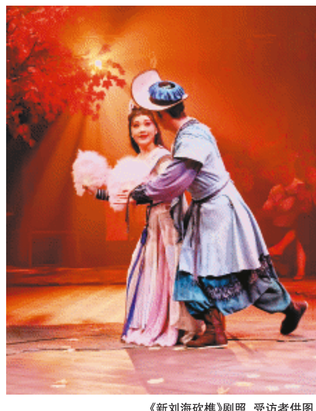
《新刘海砍樵》剧照

长沙文化夜宴上的大菜，除了一台好戏，还有“两口相声”：一是得乐社，二是笑工场。 夜幕降临，都正街上的得乐社剧场灯火通明，笑声不时从屋里飞出，在夜空中飞得很远很远。这是长沙首家每晚都表演相声的茶馆，以其传统经典、滑稽小品、对口相声、爆笑脱口秀等节目形式，线上线下快速聚拢粉丝600多万人。 下转4版