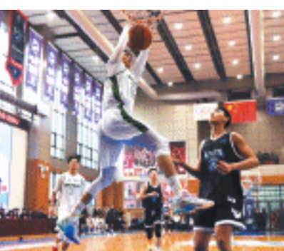
“校BA”总决赛，选手飞身扣篮。