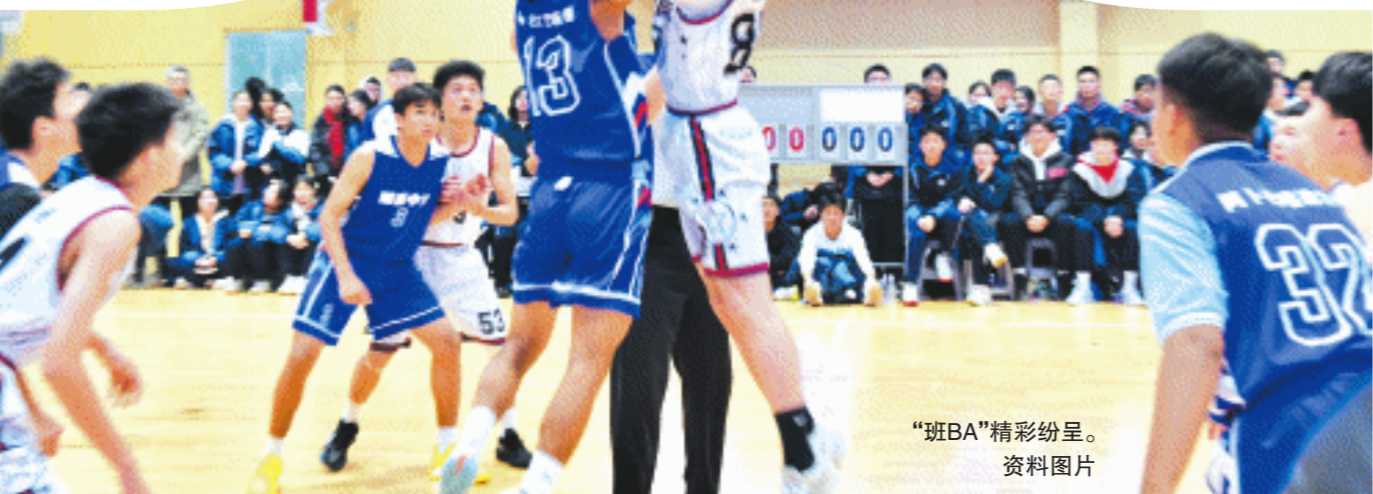
“班BA”精彩纷呈。资料图片

不仅可以与园区IP形象合影打卡，还能与可爱的海洋动物人偶进行亲密互动，参与现场互动游戏更有机会赢取湘江欢乐海洋公园免费门票。为感谢广大游客一年来的支持，湘江欢乐海洋公园特别推出“鲸喜海洋”主题活动，以“鲸喜海洋”为主题，推出“鲸喜海洋”主题活动，以“鲸喜海洋”为主题，推出“鲸喜海洋”主题活动。