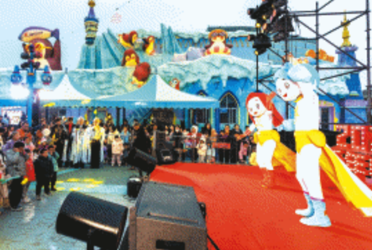
湘江欢乐海洋公园开启1周年庆狂欢季活动。长沙晚报全媒体记者 董阳摄

长沙作为省会城市积极响应号召，10月起启动中小学班级“三大球”联赛，掀起全市校园运动热潮。全市各中小学校都举行了“三大球”学校初赛，并都决出了冠军班级。比赛中，男生女生都要上场，班主任老师也参与到比赛中来，比如班级篮球赛中中场休息时间由班主任罚篮并计入总分，有效调动了班主任的参与热情，促进了师生关系，更有利于班级管理。 此外，班级三大球联赛也有效解决了重竞技轻普及的问题。此前长沙市的高水平运动队参加长沙市青少年U系列竞赛，普通学生没有赛事，现在普通学生可以参加班级“三大球”联赛，完善了长沙市校园体育竞赛体系，有效解决了重竞技轻普及的问题。同时，在比赛中也能发掘一批具备潜力的学生，进一步促进竞技体育的发展。