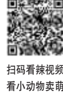
扫码看视频 看小动物卖萌