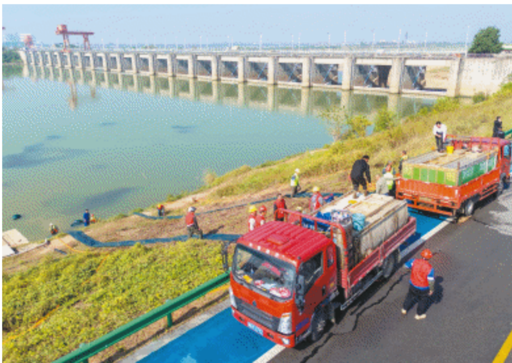
湘江长沙综合枢纽工程工作人员在投放鱼苗。

守护一江碧水，保护鱼类资源也是湘江长沙综合枢纽工程的重要使命。“目前，我们通过增殖放流站实现增殖珍稀鱼类功能，利用鱼道保障鱼类洄游通道畅通。”徐天宝说，湘江长沙综合枢纽工程已连续10年对湘江人工增殖放流，累计投放鱼苗约2亿尾。投放的鱼苗以四大家鱼为主，同时自行培育并放流了80多万尾珍稀鱼类，包括胭脂鱼和中华倒刺鲃、长薄鲮和白甲鱼等品种。