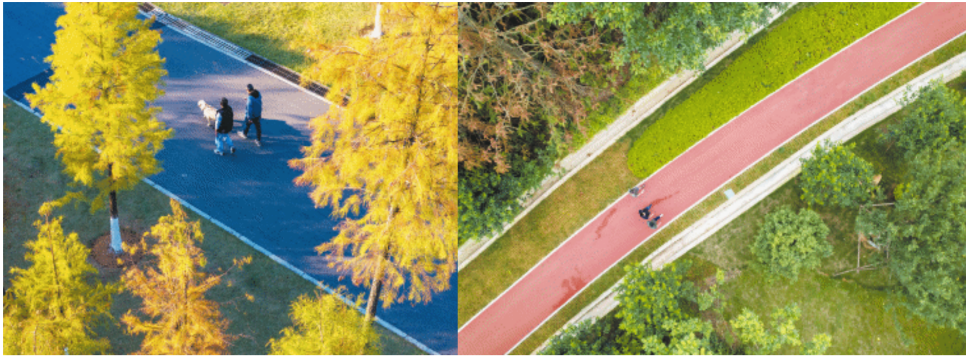
冬日暖阳,风景怡人,市民在西湖公园散步。