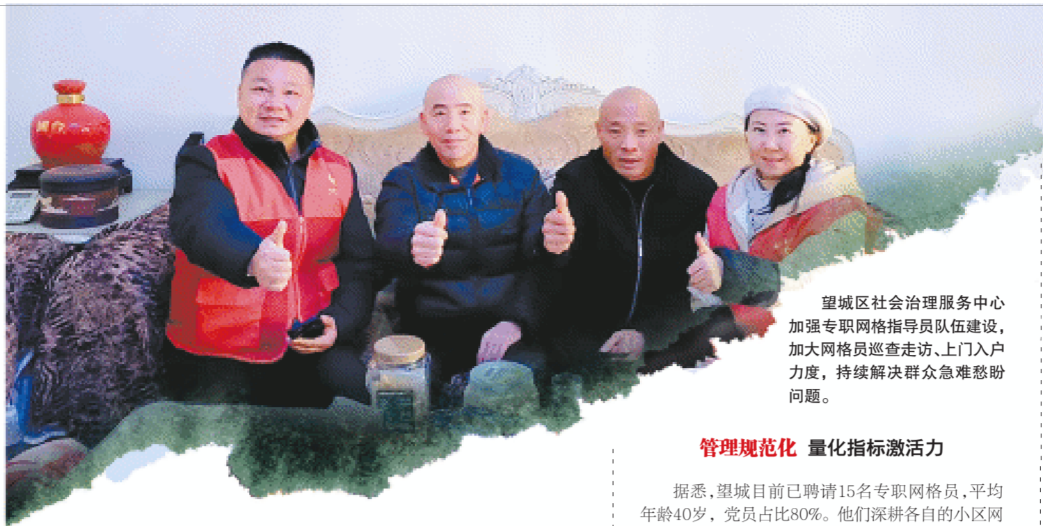
望城区社会治理服务中心加强专职网格员队伍建设，加大网格员巡查走访、上门入户力度，持续解决群众急难愁盼问题。