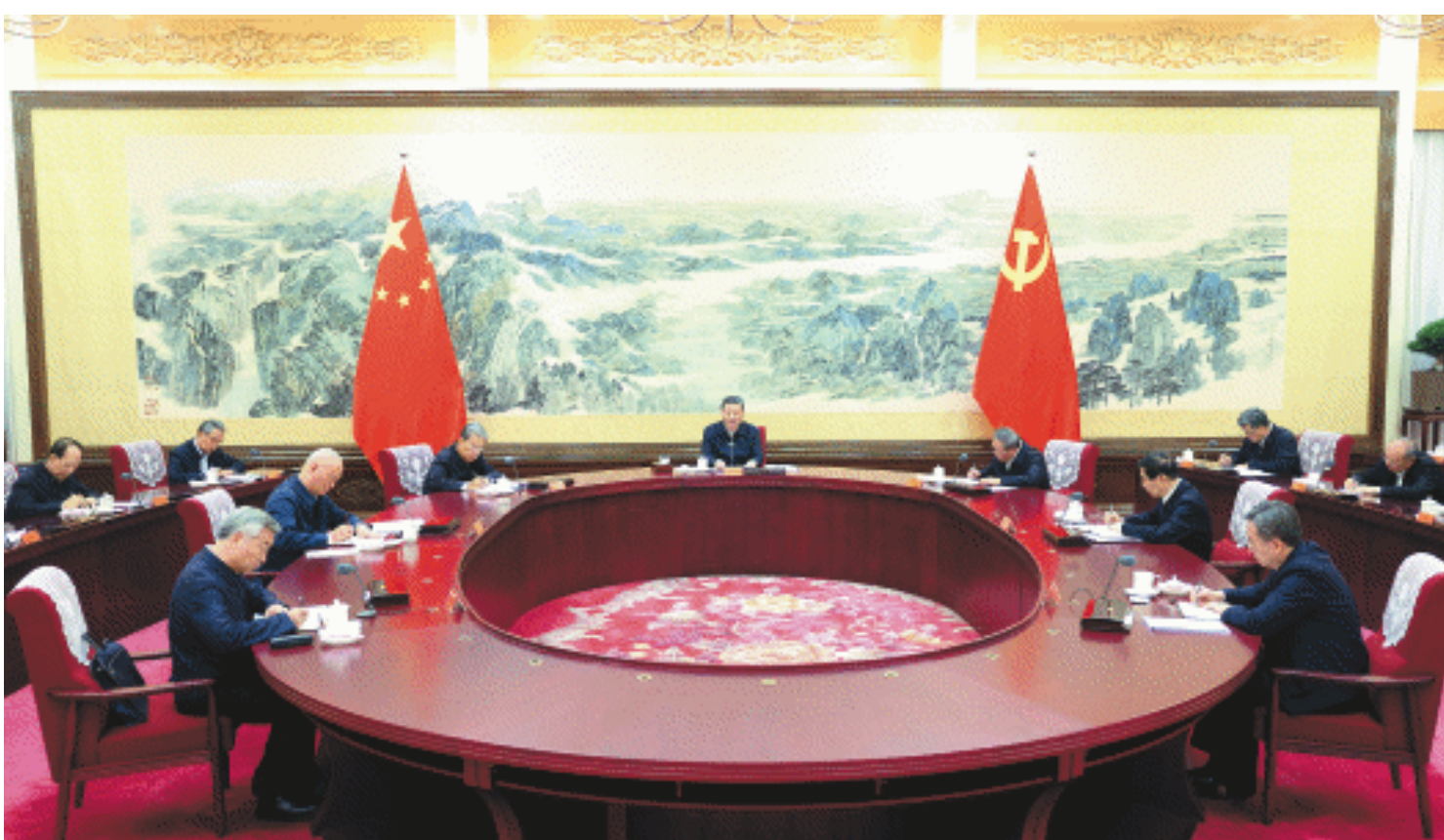
12月26日至27日，中共中央政治局召开民主生活会，中共中央总书记习近平主持会议并发表重要讲话。

新华社北京12月27日电 中共中央政治局于12月26日至27日召开民主生活会，深入学习贯彻习近平新时代中国特色社会主义思想，围绕巩固深化党纪学习教育成果、综合发挥党的纪律教育约束和保障激励作用，把学习贯彻纪律处分条例、落实中央八项规定情况作为检查的重要内容，结合思想和工作实际进行自我检视、党性分析，开展批评和自我批评。 中共中央总书记习近平主持会议并发表重要讲话。