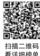
扫描二维码 查看详细榜单

参与国家重大决策部署积极主动。三湘民营企业百强中,参与混合所有制改革的企业13家,参与乡村振兴战略的企业67家,参与“万企兴万村”行动的企业65家,参与污染防治攻坚战的企业73家。参与区域协调发展战略的企业为62家,其中参与中部地区崛起战略、长江经济带发展和粤港澳大湾区建设的企业分别为39家、22家、18家。