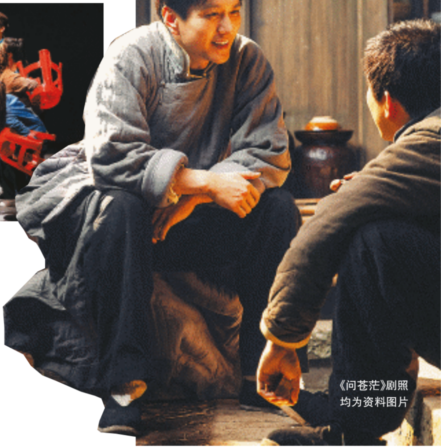
《问苍茫》剧照均为资料图片

而在荧幕上,“湘派”电视也是春风得意。《问苍茫》在央视一套黄金档热播时,播出期间收视一路领先,豆瓣也获得了8.8的高分。