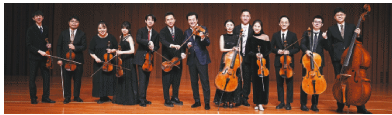
中央音乐学院博士“天团”——“美杰新青年乐团”合影。

长沙晚报12月29日讯(全媒体记者 肖舞) 还剩2天,又是一年跨年夜。跨年夜,怎么过?听什么?你选择好了吗?12月31日22时30分,长沙晚报社与长沙音乐厅携手中央音乐学院博士“天团”——“美杰新青年乐团”,将打造跨“乐”2025——“长沙晚报之夜”长沙音乐厅第六届跨年音乐会,在前所未有的“青和力”爆棚的长沙City,引领跨年新潮流。