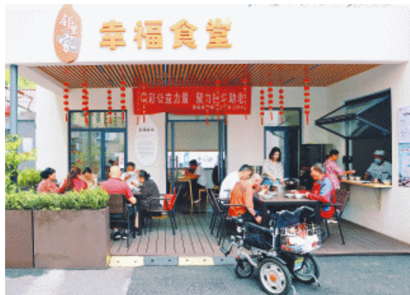
2024年5月23日,浏阳市集里桥社区幸福食堂开饭,20多名老人在此用餐。

“聚焦群众日益增长的健身需求,2024年,浏阳新改建室外运动场19个、智慧社区健身中心3个、国球进社区(公园)5个。”浏阳市文旅广体局相关负责人介绍,截至目前,浏阳拥有各类体育场地6000余处,体育场地面积约540万平方米,人均体育场地面积达3.8平方米,居长沙九区(县、市)第一。 在浏阳,一桩桩民生实事于细微处着眼,于贴心处落地,助力公共服务更便捷,群众生活品质再提升。 “岗位”无淡季。针对不同群体,浏阳精准发力打出就业服务“组合拳”;对于困难群体就业,采取专场招聘的形式,加大就业兜底帮扶力度,实现零就业家庭动态清零;针对灵活就业人员,建设浏阳市家庭服务业零工市场,举办“互补式”用工专场招聘会,因地制宜将