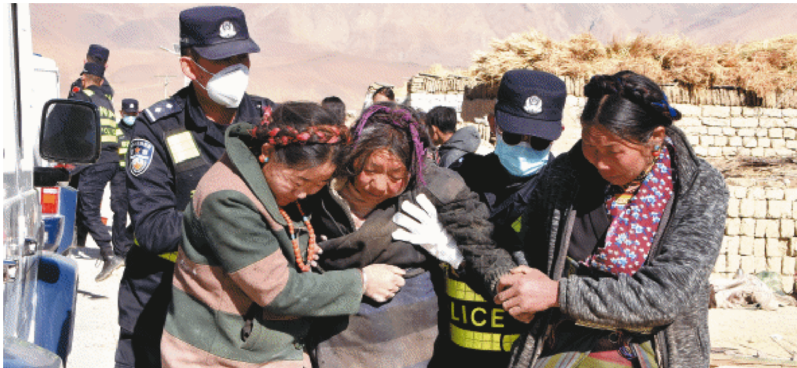
1月7日，救援人员在定日县扎村转移伤员。

防控队(西藏)建制赴灾区；组派国家疾控中心工作组于当日赶赴灾区；组织中国疾控中心开展地震灾区灾后公共卫生风险评估。