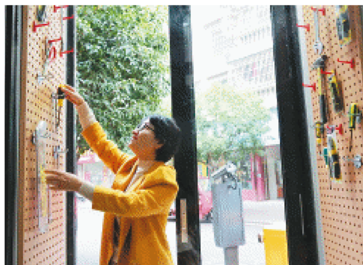
居民通过“共享工具房”挑选趁手的工具。

近年来,农械厂小区完成改造后,漏水的老旧管道换成了新的;居民楼外墙、楼道得以重新粉刷;蜘蛛网一般杂乱的网线、电线也埋到了地下;路面硬化后,