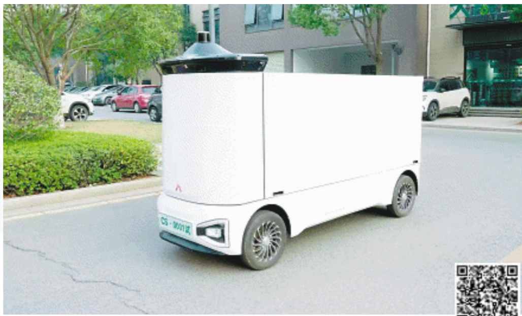
行深智能公司最新发布的末端配送新旗舰——“换熊”城配无人车，荣获中国快递协会颁发的“2024年度绿色快递示范产品”奖。