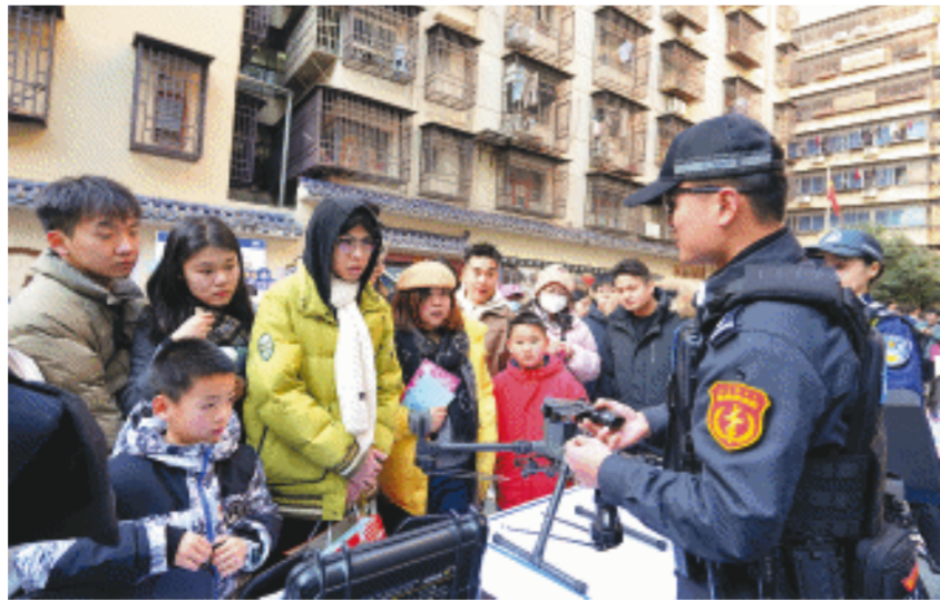
1月10日，坡子街派出所举行警营开放日活动。图为民警向市民介绍各类高精尖装备。

在特警装备展示区，各类高精尖装备整齐排列，凯拉夫防护服、警用无人机等一应俱全。民警们耐心地为市民讲解各种装备功能，让大家在更加了解警察工作的同时，也增强了对社会治安的信心。