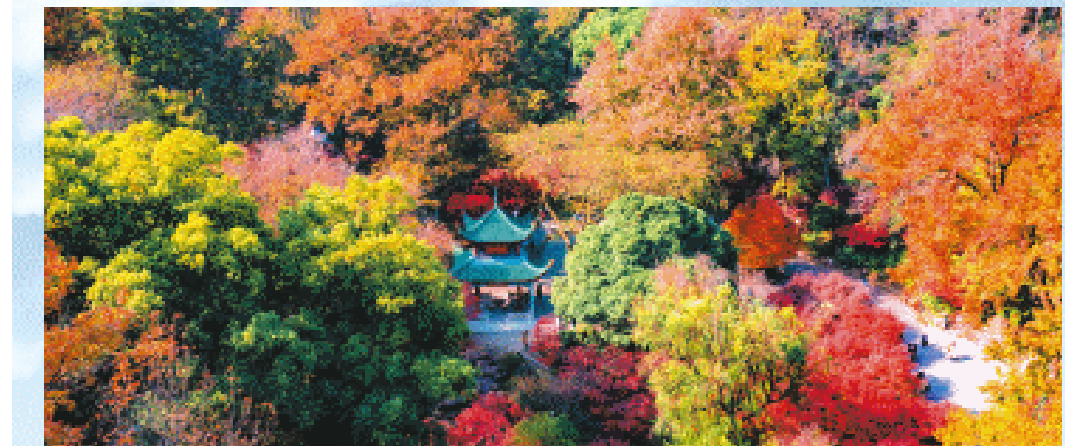
长沙晚报全媒体记者 彭玮蔚 陈焕明 彭放 范宏斌

天上有颗“长沙星”，地上有座长沙城。麓山巍峨，湘水绵长，星城长沙三千载城址不变，以其坚韧与包容，不断书写着这片土地的辉煌与梦想。 日前，《长沙市国土空间总体规划（2021—2035年）》获国务院正式批复。这份总规不仅承载着长沙对未来的美好愿景与宏伟蓝图，更关乎每位市民的民生福祉与心之所向，为加快实现“三高四新”美好蓝图、奋力推进中国式现代化长沙实践提供重要支撑保障。 市委常委会会议研究国土空间规划工作时强调，要抢抓国务院批复《长沙市国土空间总体规划（2021—2035年）》的机遇，进一步优化资源配置、促进经济发展、提升治理水平，以国土空间规划落地落实推进高质量发展。 一幅更加繁荣、更加和谐、更加美好的星城图景正徐徐铺开。让我们进一步把思想和行动统一到党中央决策部署及省委省政府、市委市政府工作要求上来，凝心聚力、同心实干，阔步迈向2035，努力将长沙建设成“智造创新名城、幸福山水洲城”。